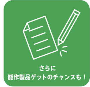
さらに 能作製品ゲットのチャンスも!

すべての地点でスタンプを集めると もれなくうれしいプレゼントがもらえる! 内容はすべて集めてからのお楽しみ!