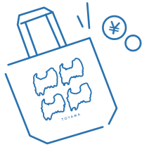
トートバッグをゲット